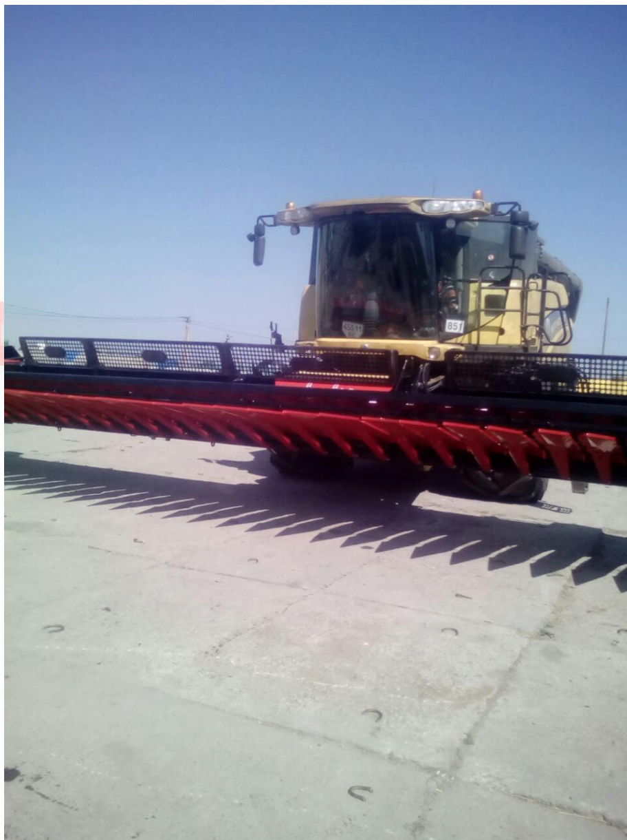
Фото жнивarki з встановленою Екран-сіткою.

*Гідравлічний привід мотовила та гідравлічне регулювання положення труби. **Механічний привід мотовила та механічне регулювання положення труби.